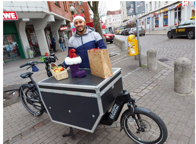
Weihnachtsaktion mit dem Lastenrad