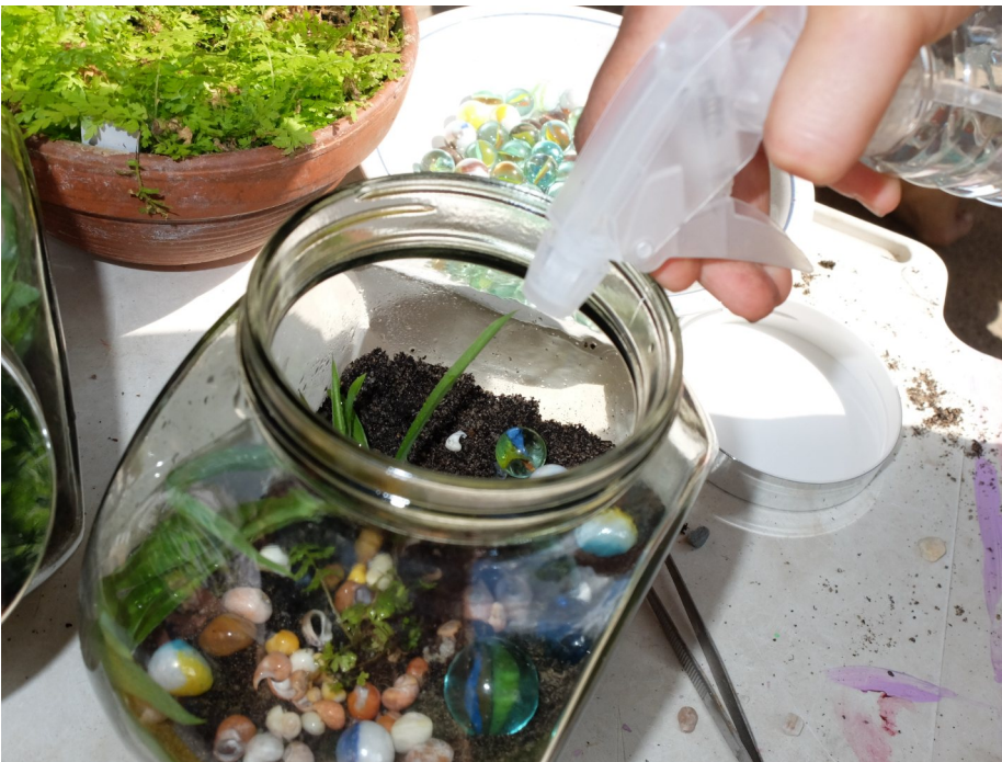
Kreativ-sein im Interkulturellen Garten: Wir basteln Flaschen-Gärten