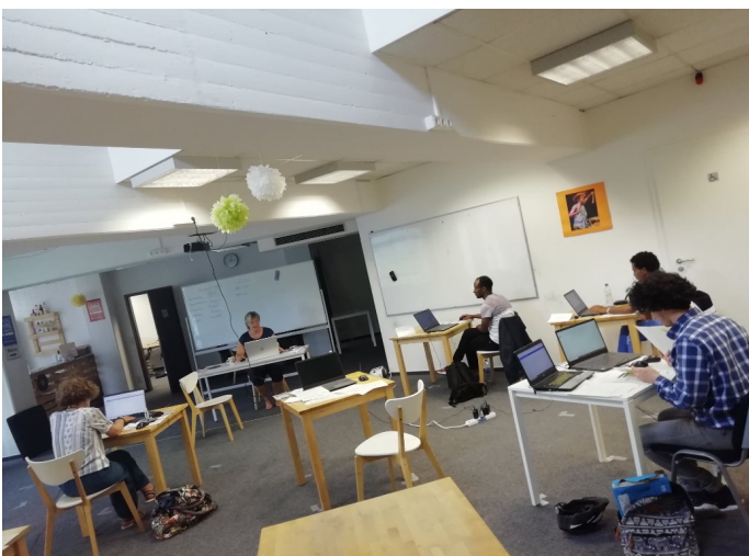
Excel-Kurs im ZEIK

Die ZBBS und das ZEIK als Veranstaltungsort sind durch das Projekt weithin bekannt geworden als Anbieter von Computer-Kursen für Geflüchtete und Migrant*innen. Die Kursteilnehmenden fragen nach Folge- oder ergänzenden Kursen. Es gibt eine lange Warteliste. Das Team der Kursleitenden hat umfangreiche Erfahrungen im Unterrichten der Zielgruppe gesammelt und arbeitete gut zusammen. Das breite Wissensspektrum der Kursleitenden ermöglichte das bedarfsgerechte Anbieten von Kursen und Förderunterricht für die Auszubildenden. Das Projekt war ein Erfolg und soll unter Einbindung der gesammelten Erfahrungen weitergeführt und ausgebaut werden.