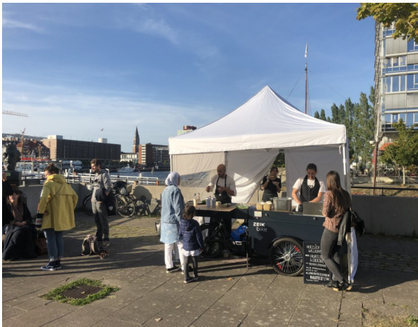
Eröffnung des ZEIK-Bikes an der Kieler Förde

Und so kam es in der Weihnachtszeit dazu, dass Weihnachtspakete gefüllt mit verschiedenen Hygieneartikeln und Leckereien mithilfe des Lastenrades an obdachlose Menschen in Kiel verteilt wurden und wir konnten diesen Menschen somit eine kleine Freude in diesen schwierigen Zeiten bereiten.