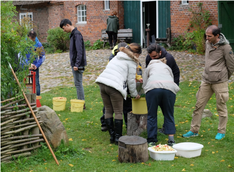
Apfelsaftpressen - ein Ausflug mit dem Interkulturellen Garten