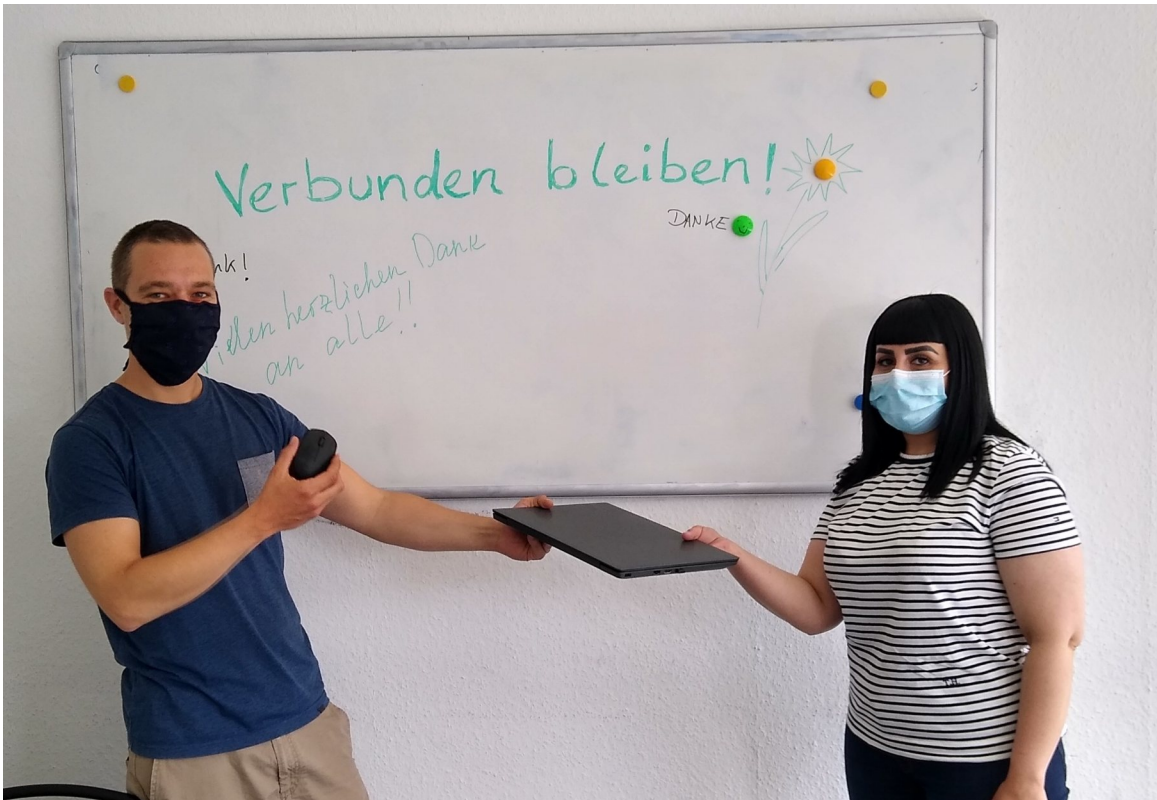
Laptopübergabe im Projekt KOALA: Wir haben Laptops gespendet bekommen, damit möglichst alle am Online-Unterricht teilnehmen können.